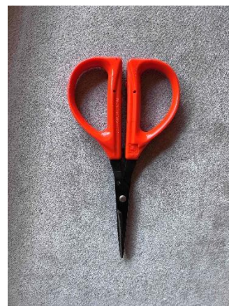
・近正（CHIKAMASA） 「フローリスト NS-140S 万能ハサミ」