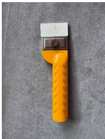
・オルファの「別たち 56B」